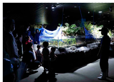
ナイトアドベンチャー